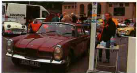
Une Facel-Vega au départ de Bourges

Grande Motte, le Larzac et les Grandes Causses.